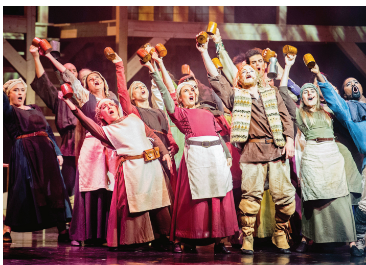
«Guillaume Tell» a été présenté au Théâtre du Martolet à Saint-Maurice. HÉLOÏSE MARET

En concert le 24 juin au Festival des 5 Continents, Martigny et le 3 août au Palp Festival, Martigny. www.meimuna.ch